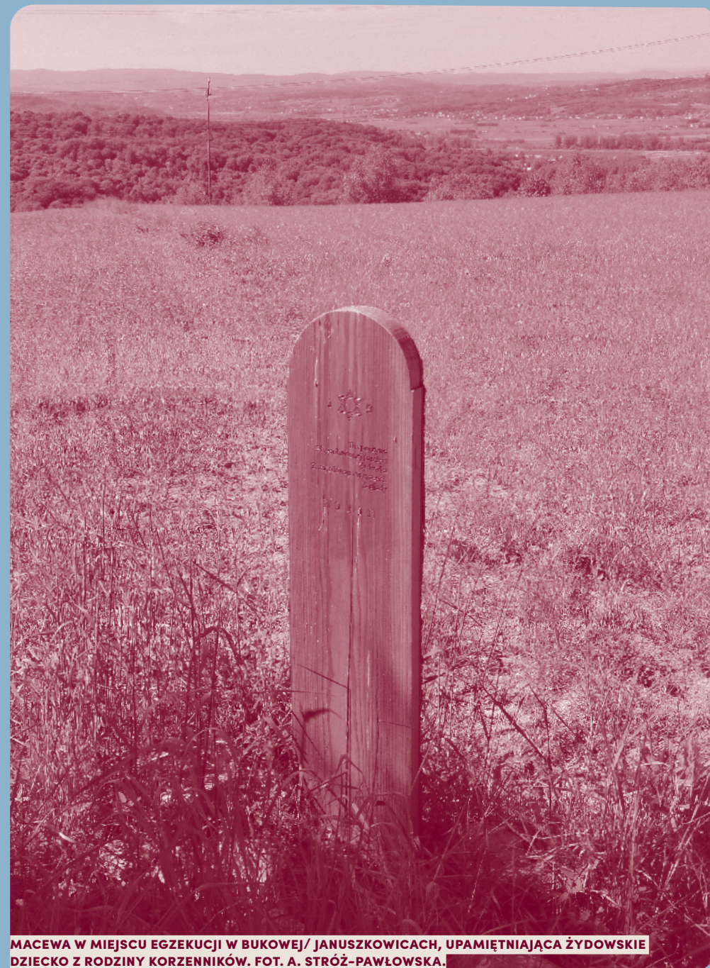
MACEWA W MIEJSCU EGZEKUCJI W BUKOWEJ/ JANUSZKOWICACH, UPAMIĘTNIAJĄCA ŻYDOWSKIE DZIECKO Z RODZINY KORZENNIKÓW.