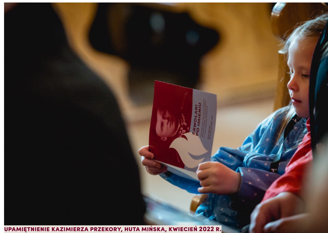
UPAMIĘTNIE NIE KAZIMIERZA PRZEKORY, HUTA MIŃSKA, KWIECIEŃ 2022 R.